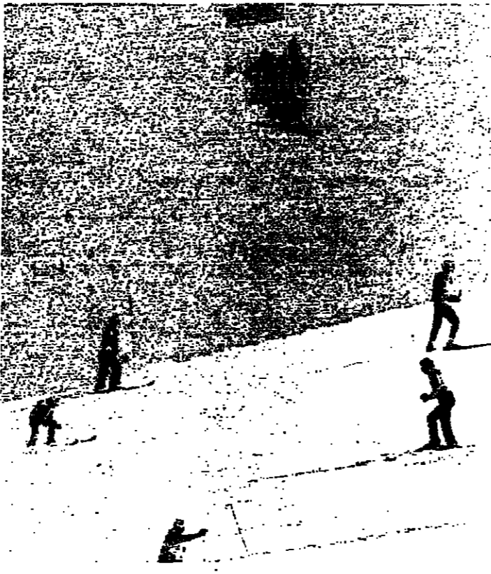
في غاريا متزلجون في السمسار وعلى الارض